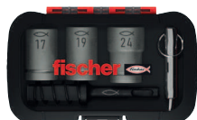
Set FA-ST II